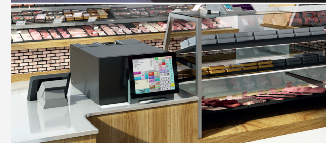
TIENDAS DE ALIMENTOS FRESCOS