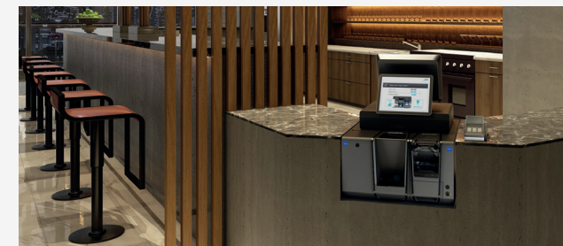
NEGOCIOS DE HOSTELERÍA